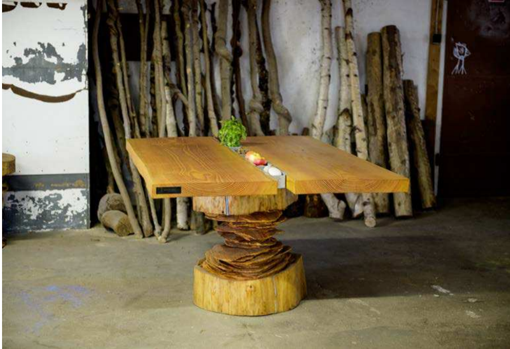
Sprækken i midten kan sagtens udnyttes både til pynt eller brug.